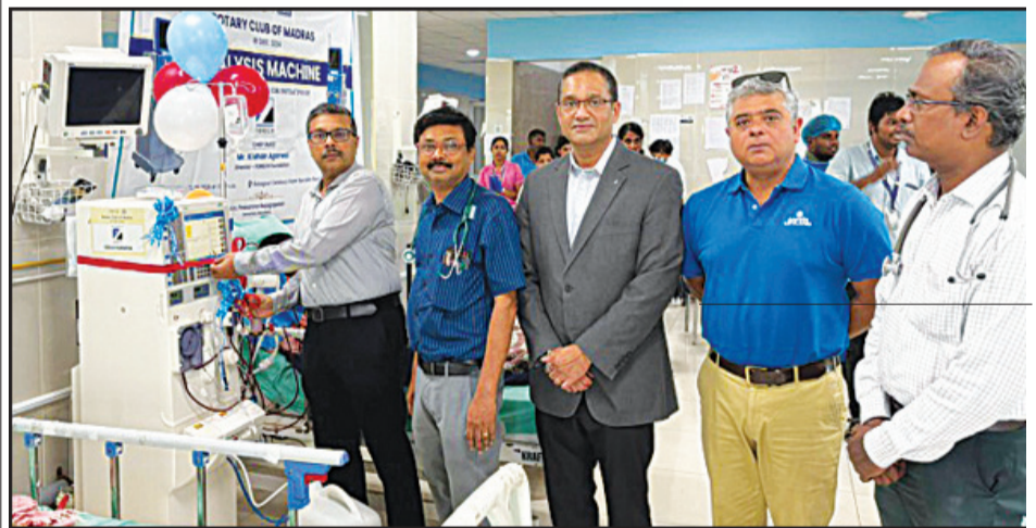
Rotary Club of Chennai Kilpauk donated four dialysis machines to the free Rotary Kilpauk