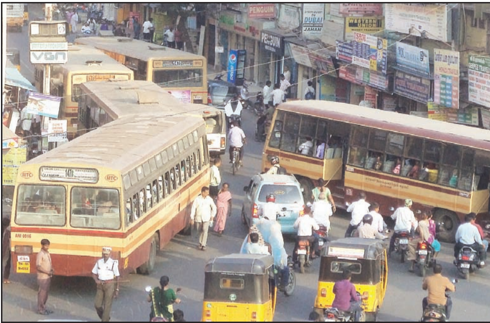
By Our Staff Reporter MTC bus terminus was among Chennai Unified Metropolitan Redevelopment of T. Nagar the key projects cleared by the Transport Authority's Sub-

committee on non-motorised transport and infrastructure at its recent meeting.