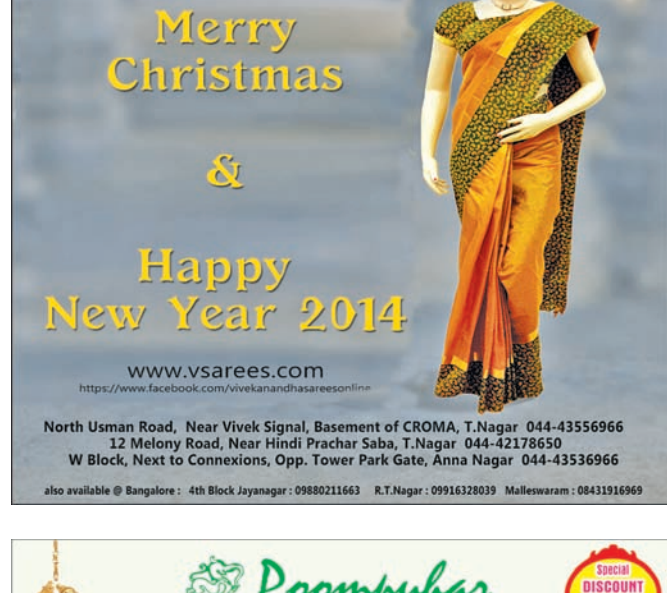
By Our Staff Reporter

A woman making Christmas purchases in a shop on Thanikachalam Road, T. Nagar and a boy spotted selling Santa Claus masks and caps on Venkatanarayana Road, T. Nagar on Dec. 19.