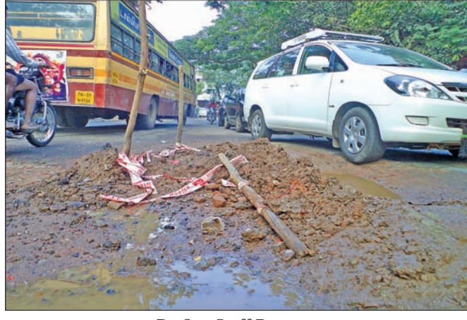
By Our Staff Reporter

Repair work being conducted by Metrowater at the junc- from Friday tion of Govindan Road and Pushpavathi Ammal Street in By Our Staff Reporter West Mambalam is creating problems for road users.