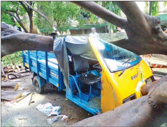
By Our Staff Reporter on the road margin suffered heavy damages when a tree inside the compound of (Bharathida-san Colony Road, Bhuvanesh-wari Apartments K.K.Nagar) toppled and fell on

them after the heavy showers on Sept. 11.