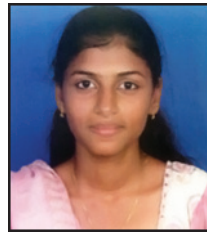
S. Angelin Diney 1106