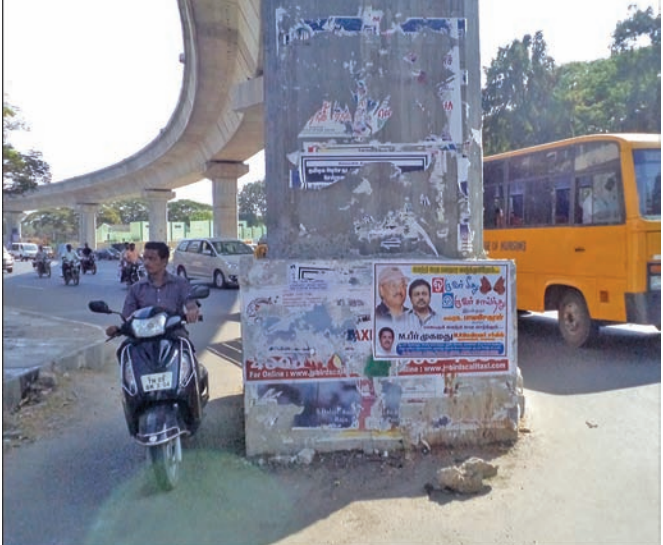
By Our Staff Reporter

There are no reflectors on the Metro Rail pillar at the poorly illuminated junction of 15th Avenue and Ashok Pillar (near UdhayamTheatercomplex). It is not clearly visible at night and poses a danger to motorists.