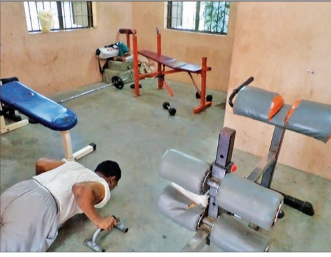
By Our Staff Reporter

There are no regular visitors to the small Chennai Corpora-Temple (Moorthy Street Extion Gymin Natesan Park, Venkatanarayana Road, T. Nagar due to lack of space and proper exercising equipment.