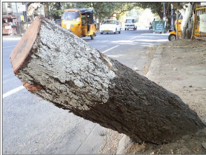
By Our Staff Reporter

A leaning avenue tree on the road margin at the junction of Nair Road and Raman Street (T. Nagar) was cut long ago.