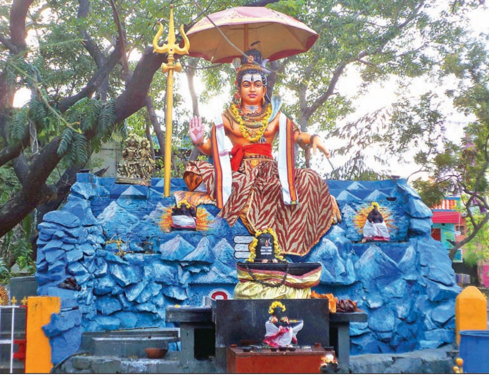
By Our Staff Reporter

Special pooja wil be performed to Lord Shiva on Sunday, March 10, at 4 p.m in Sivan Park Property" authored by Swa- (P. T. Rajan Salai, K. K. Nagar) to celebrate Maha Shivarathiri. This will be followed by