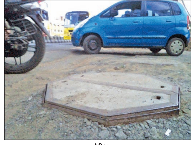
By Our Staff Reporter