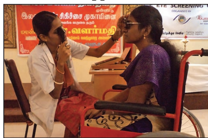
By Our Staff Reporter

In view of International Women's Day, Rajan Eye Care Brahmayogananda will give a Hospital (T. Nagar), in association with Rotary Club of Madras talk on 'Sivan Avan Thalaivan' (T. Nagar wing), conducted a free eye screening program for on Sunday, March 10 at 7 p.mat Road (Nandanam) on Feb. 3 dation constructed for building ing to position the vehicle to more than 100 physically challenged women members of 25, Chakrapani Street Exten- near the construction site of a the wall. A number of labourers pour out the concrete when it Tamilnadu Han-dicapped Federation on March 8, in its presion, West Mambalam.