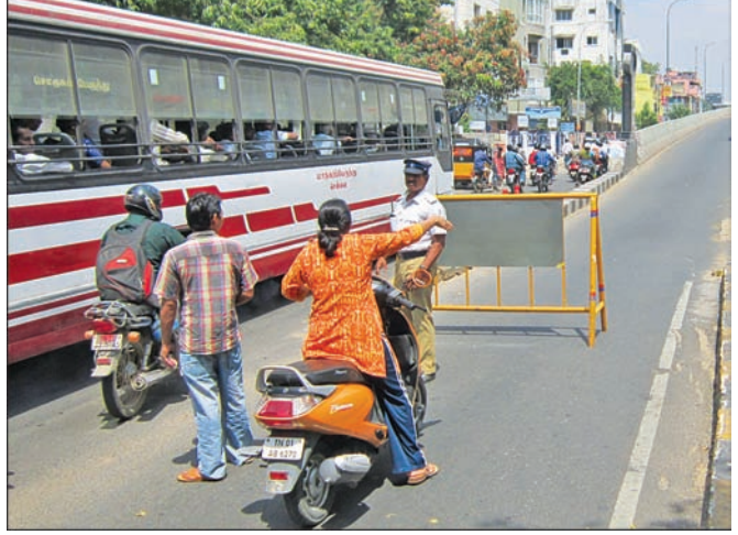
By Our Staff Reporter

At around 11 a.m on March more than 600 persons belong-sioner be removed. ing to Tamizhar Desiya raised slogans against the Sri Road.