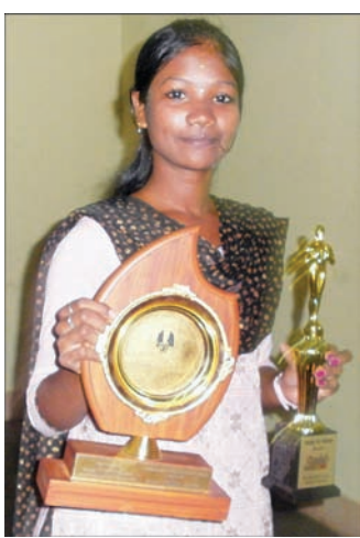
By Our Staff Reporter

Mambalam) won the gold sh, cakes, cookies and flakes medal in 100 m running race made from red rice, brown rice, and the silver medal in the 400 ragi, and kambu. Organically Nagar) bagged the "Best Scout Chennai Bharat Scouts and given the "Best Scout Master" conducted by All India Handicapped Rehabilitation Center 22436. in Chennai last week.