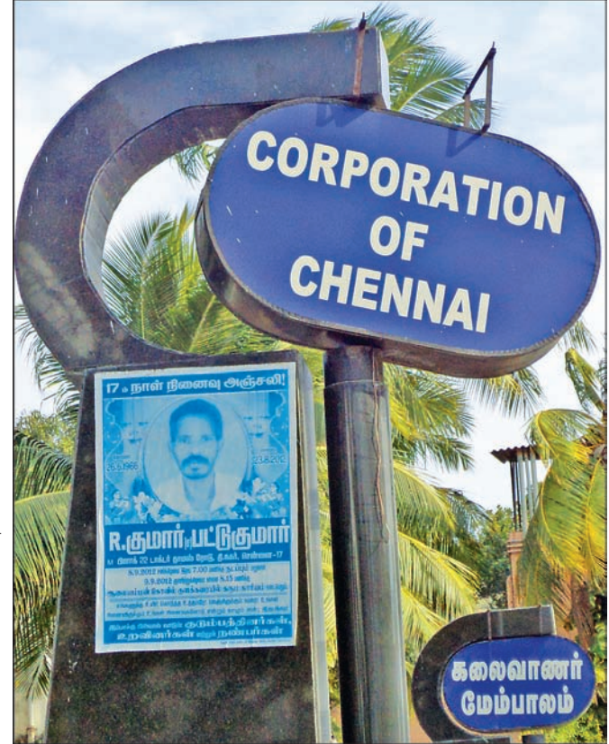
By Our Staff Reporter

The signboard fixed on a designer pedestal at a height of 10 feet at the entrance of Kalaivanar flyover on G. N. Chetty Road More details can be had in (T. Nagar) is slanting precariously and is likely to fall on the kolam; 6.30 a.m. Procession. road, posing a danger to motorists.