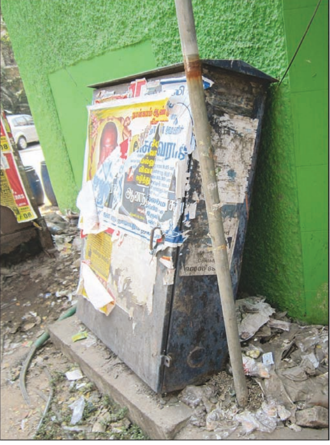
By Our Staff Reporter

The BSNL telephone junction box which came off its base a week ago is leaning on the compound wall of the building adjacent to it on Arulambal Street, T. Nagar.