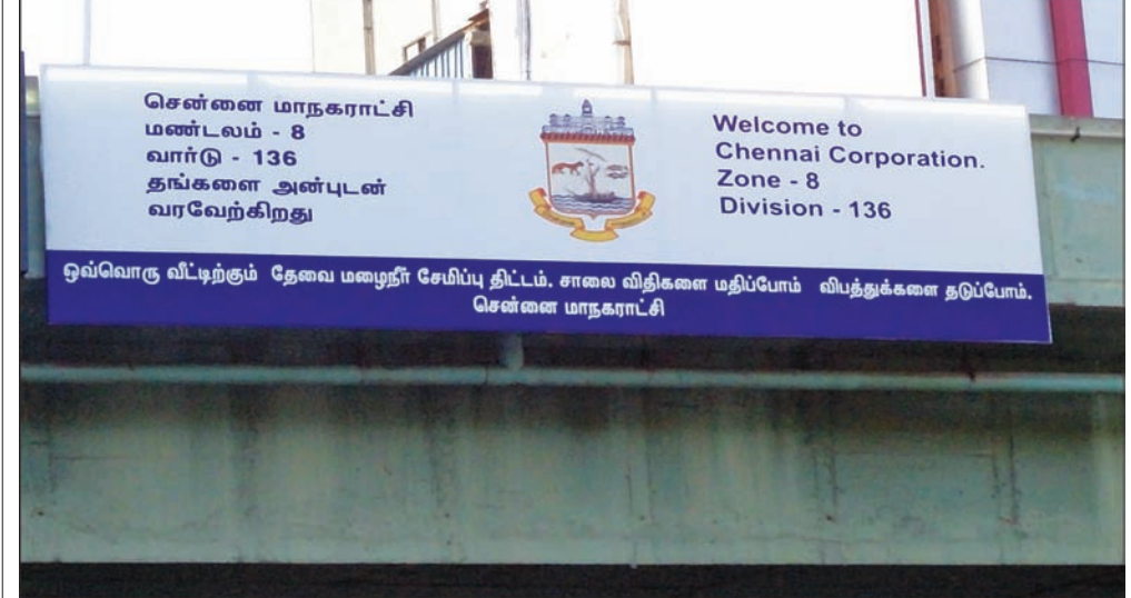
By Our Staff Reporter

Corporation \ Zone\ 10\ has\ been\ wrongly\ mentioned\ as\ Zone\ 8\ on\ the\ newly\ installed\ signboard on the parapet wall of Usman Road flyover, opposite Nageshwara Road, T. Nagar.