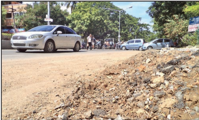
This is how 4 th (above) and 11 th Avenues looked like on June 30. Though Metrowater Board has completed a project to lay pipes on these stretches, earth removed from the trenches has still not been cleared.

1 st , 4 th and 11 th Avenues in Ashok Nagar and Ambedkar Salai in Kodambakkam are among the 30 bus route roads in the city which will be upgraded by Chennai Corporation into 'world class roads' in the first phase of its ambitious plan. The Corporation, in an announcement on June 25, said that the 4 roads with a total length of 3150 meters, had been chosen after discussions with Metrowater Board and Electricity Board officials, and representatives of the consultancy firm chosen for the project. 1 st Avenue has a length of 300 meters, 4 th Avenue 1250 meters, 11 th Avenue 1000 meters and Ambedkar Salai 660 meters. The upgradation will include superior pedestrian facilities and will be disabled friendly.