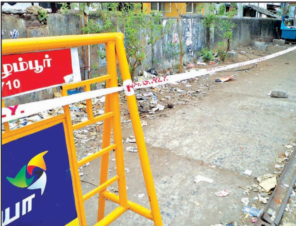
By Our Staff Reporter

Following strict action taken on the west side of Mambalam Station reservation office has come down. RPF personnel have placed barricades with reflector tape in the no parking area. They are also collecting Rs. 200 as fine from offenders.