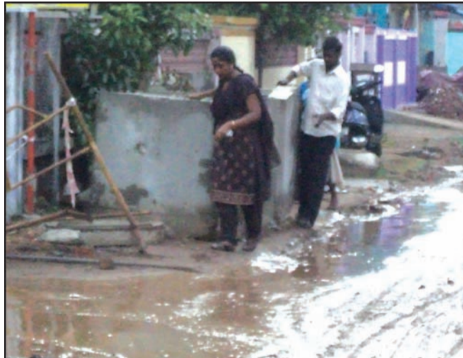
By Our Staff Reporter

Heavy showers on July 28 turned Karikalan Street in Pari Nagar, Jafferkanpet into a slushy stretch as stormwater drain work is in progress. Pictures show how pedestrians negotiated the slippery conditions.