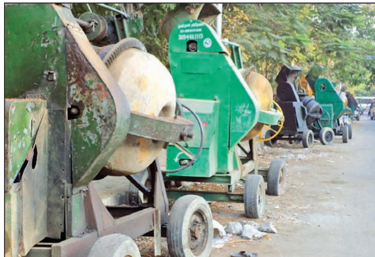
By Our Staff Reporter These concrete mixers belonging to a contractor have been lying on the margin P. T. Rajan Salai, K. K. Nagar for more than a month.

Under the auspices of Art of Living, there will be a free meditation class at 6 p.m on Sunday, May 20 in Sri Lalitha Kala Shetra, 9, K. R. Koil Street, West Mambalam.