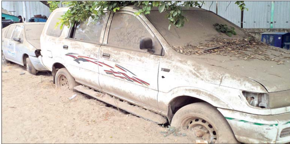
Two abandoned vehicles have been lying at the P. V. Rajamannar Salai-P. T. Rajan Salai junction, K. K. Nagar for several years. Both are in a damaged condition and do not have number plates.