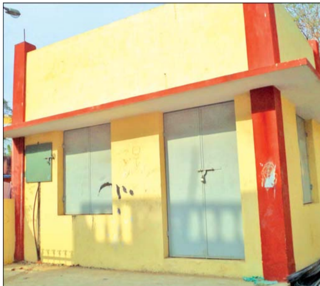
By Our Staff Reporter It is happy news for the staff of the TUCS ration shop now functioning in a dilapidated building in the TNHB complex. Continued on page 8

21,000 copies of this edition are delivered FREE every Sunday!