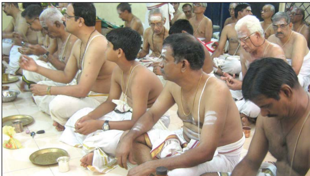
By Our Staff Reporter

A number of persons participated in the 'Samaveda Upakarma' organized by Tamil Nadu Brahmin Association, K. K. Nagar on Aug. 31.