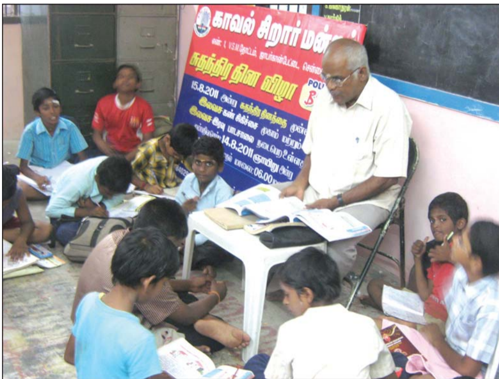
By Our Staff Reporter

Free coaching classes for members of Kumaran Nagar Police Station Boys Club (1, VSM Garden, Jaffer Khanpet) studying in Stds. 6 to 9 commenced last week.