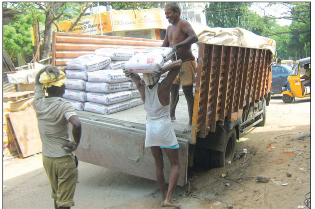
By Our Staff Reporter

The right rear wheels of a lorry (TN 05 Y 5095) loaded with cement bags got stuck in an improperly filled trench on 2nd Avenue, Ashok Nagar at 9.30 a.m. on Aug. 30. The lorry was transporting the cement from Ennore to a construction site in Ashok Nagar. It took an hour for the lorry to be moved after the cement bags were removed.