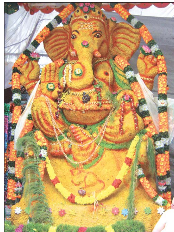
Idols on pavements (from left): On P.T. Rajan Salai, Ponnambalam Salai, and one covered with 'boondhi' outside JYM Kalyana Mandapam on Venktnarayana Road, T. Nagar.

By Our Staff Reporter includes T. Nagar, West Mambalam, Ashok Nagar, K. K. Nagar, MGR Nagar, Nesapakkam, Jafferkhanpet and