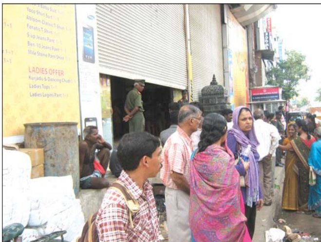
North Usman Road. It recently opened a multi-storied showroom in Purasawalkam. The group, which sells jewel-

Saravana Stores has 7 shops on Ranganathan Street, a jewellery shop and a 6-storied shopping complex on